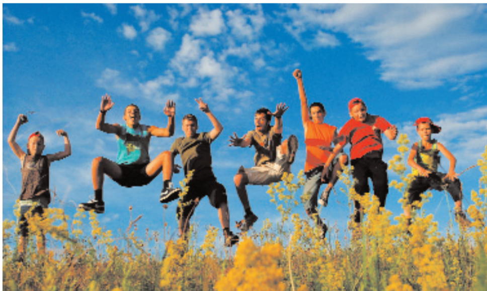
Настроение по окончании сборов и состояние здоровья отличные!!! (Не считая мозолей...)

Суть программы заключалась в том, что сборы делились на две части: