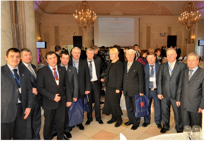
Участники съезда – главы муниципальных образований, местных администраций Невского района и их заместители.