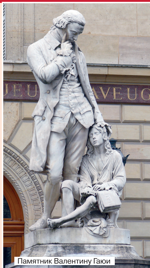
Памятник Валентину Гаюи

Депутаты и сотрудники МО № 54 благодарят актив данной организации за их важную и очень нужную для многих людей работу.