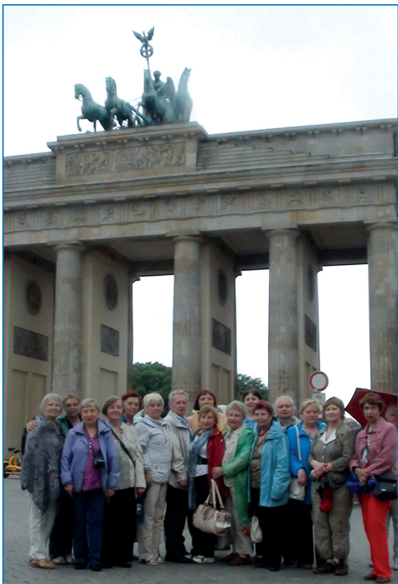
Берлин. Бранденбургские ворота

Главная идея поездки — патриотическая, чтобы мы, старшее поколение, увидели, запомнили и рассказали тем, кто не знает войны, как это страшно.