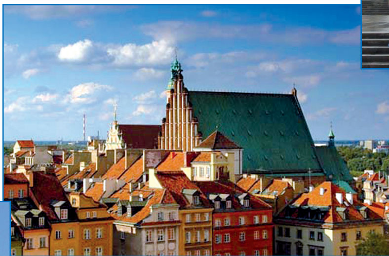
Варшава. Собор Иоанна Крестителя

На рыночной площади стоит прекрасный романтический памятник поэту Адаму Мицкевичу, на этой же площади установлен памятник символу и защитнице Варшавы — Сирене. Она стала и гербом города. Прекрасная