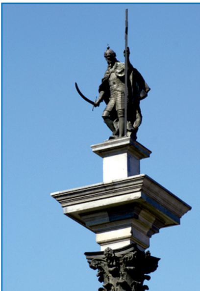
Варшава. Колонна Сигизмунда III