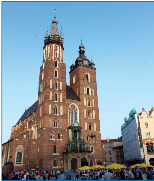
Краков. Костел Пресвятой Девы Марии

ется Кафедральный Собор — главный храм города. Здесь короновались польские монархи, и здесь же их хоронили, начиная с 1333 года. Кроме того, здесь же хоронили и знаменитых людей — так, мы видели гробницы Тадеуша Костюшко, поэтов Адама Мицкевича и Юлиуша Словацкого, военных деятелей, в частности гробницу Пилсудского. Здесь же похоронены президент Лех Качинский и его супруга Мария.