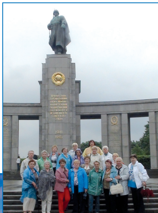
Берлин. Советский воин-освободитель

Берлин — город с четырёхмиллионным населением, расположен на реке Шпрее. Основан в 1307 году, с 1486 года был столицей Бранденбурга, с 1871 года (после объединения Германии Отто Бисмарком) стал столицей всей Германии. Город красивый, ухоженный, очень зелёный. Сейчас идет много работ по благоустройству Берлина.