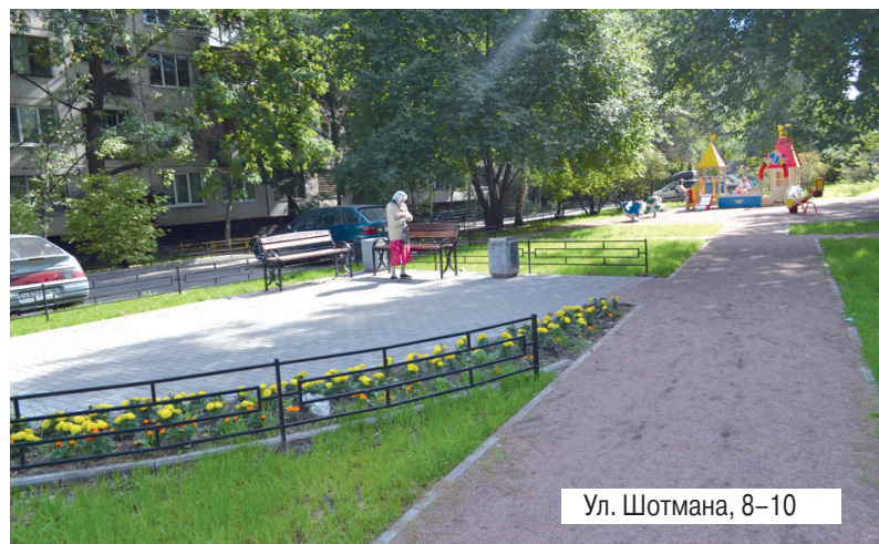
Ул. Шотмана, 8-10