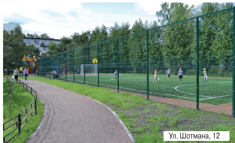
Ул. Шотмана, 12