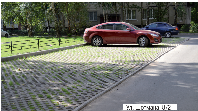
Ул. Шотмана, 8/2

Продолжаются работы по ремонту асфальтового покрытия внутридворовых проездов общей площадью 6000 кв. м. Основные адреса производства работ: Большевиков, д. 25; Большевиков, д. 25/2; Шотмана, д. 3; Шотмана,