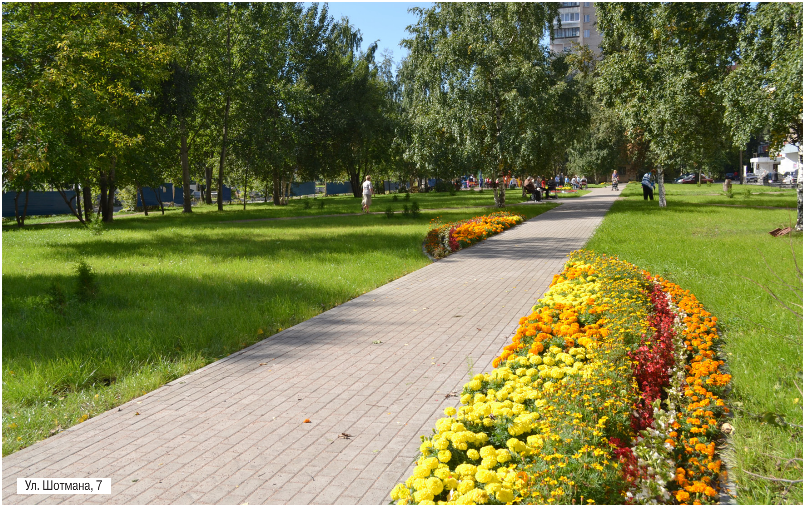
Ул. Шотмана, 7

К концу августа в нашем округе подходят к завершению основные работы по благоустройству. Большая часть их проводилась в жилом квартале, ограниченном ул. Евдокима Огнева, Искровским пр., ул. Дыбенко и пр. Большевиков (избирательный округ №165). Благоустройство данной территории совпало с реконструкцией проезжей части ул. Евдокима Огнева городскими службами, что придаст вышеуказанному кварталу законченный благоустроенный вид и позволит после завершения работ представить квартал на городском смотре-конкурсе по благоустройству в номинации «Лучший благоустроенный квартал» в следующем году.