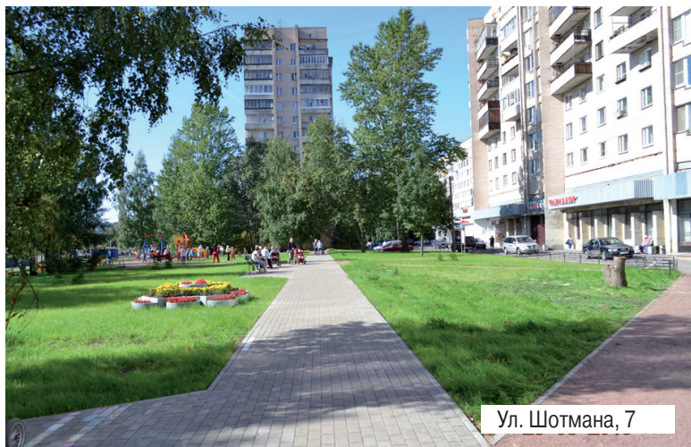
Ул. Шотмана, 7

д. 4-6; Шотмана, д. 7; Е. Огнева, д. 20; Дыбенко, д. 23/3; Дыбенко, д. 25/4; Дыбенко, д. 27. С целью повышения безопасности для пешеходов во внутривортовых проездах будут установлены 30 «лежачих полицейских». Подходы к местам отдыха будут оборудованы специальными съездами для маломобильных групп населения.