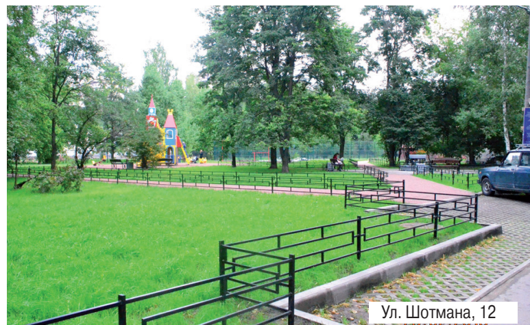
Ул. Шотмана, 12