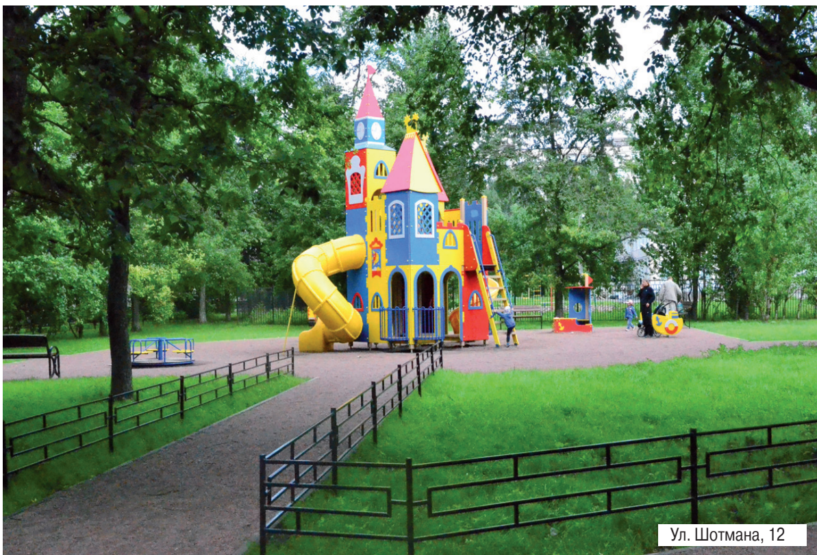
Ул. Шотмана, 12