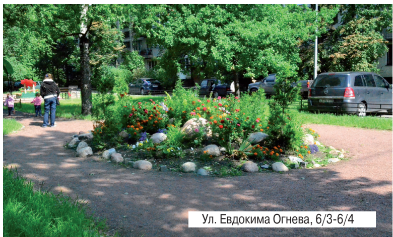
Ул. Евдокима Огнева, 6/3-6/4

Муниципальным Советом и местной администрацией МО № 54 проведена большая работа в сфере благоустройства нашего округа. Мы стараемся создать в нашем муниципалитете условия, удобные для жизни всех граждан. Красота, комфорт и удобства, которые мы создаём для вас, не могут быть сохранены без вашего активного участия, внимания и заботы.