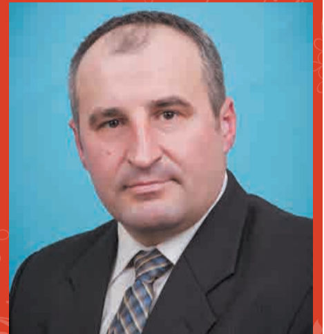
Желаем крепкого здоровья, добра и счастья, благополучия и мира, успехов и осуществления всех планов!