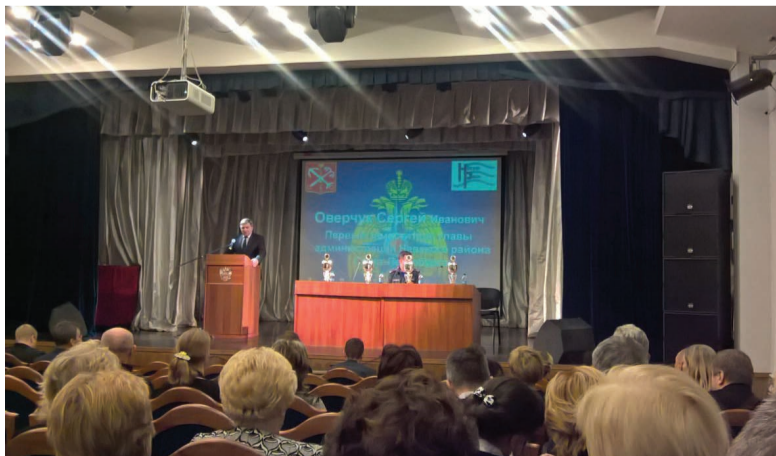
Подведение итогов работы в ДК «Троицкий».