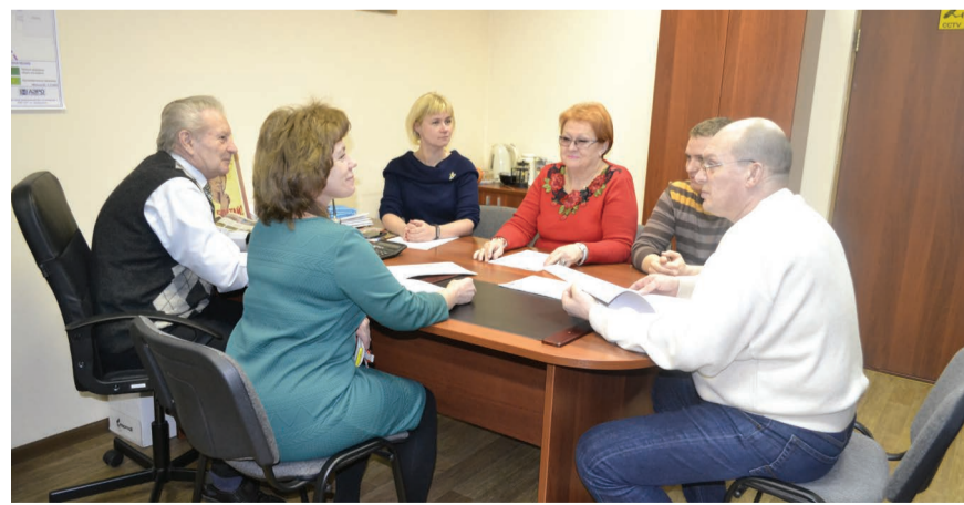
Совещание руководителей подразделений с главой местной администрации.