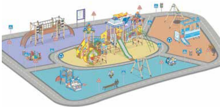
Дыбенко, 21 ДПС