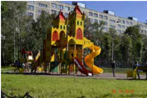
ул. Дыбенко, д. 17, к. 1