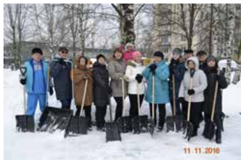
Уборка снега силами сотрудников МО МО № 54