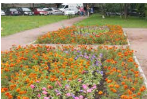
ул. Тельмана, д. 42, к. 1