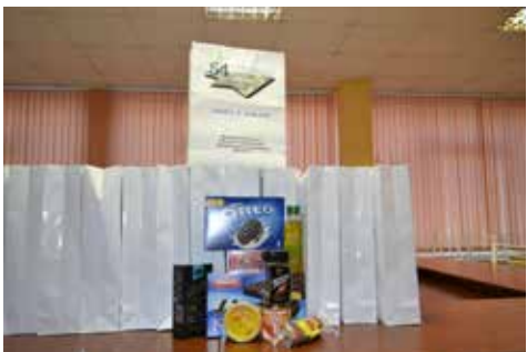
Подарочный набор к Декаде инвалидов