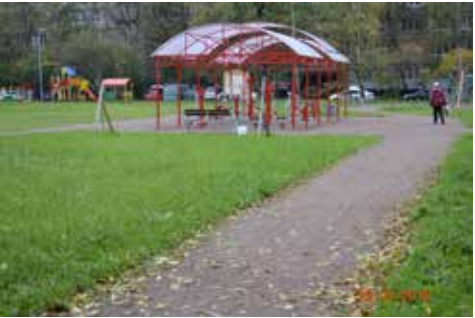
ул. Дыбенко, д. 9, к. 1