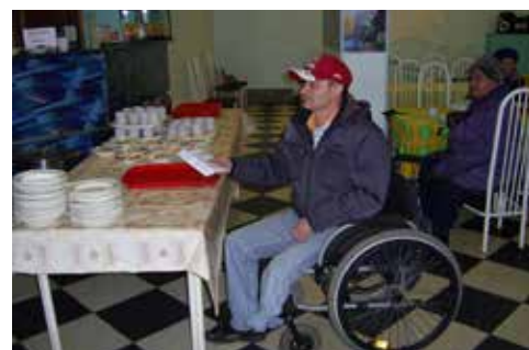
Социальная программа – бесплатные обеды в кафе «Волна»