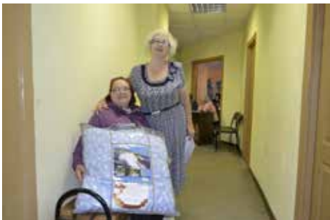
Вручение подарков ветеранам ко Дню Победы