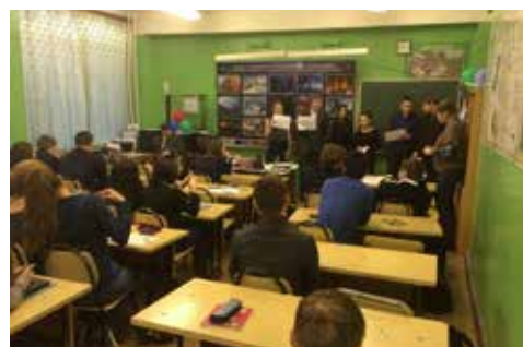
Профилактика терроризма и экстремизма