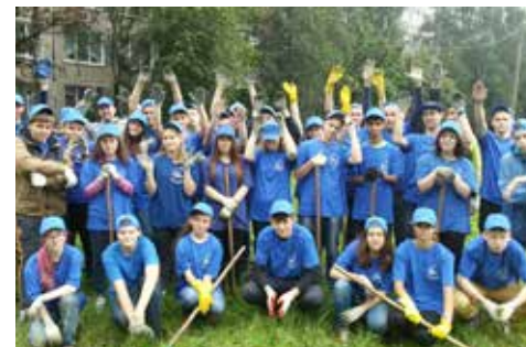
Молодежный трудовой отряд