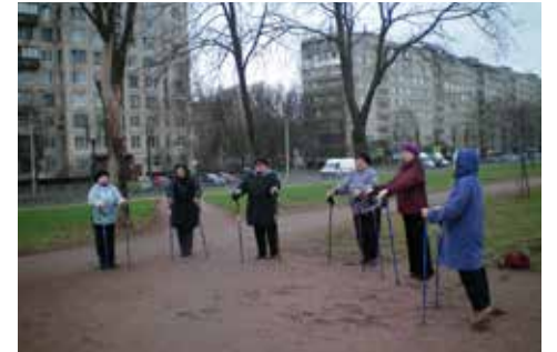
Социальная программа – скандинавская ходьба