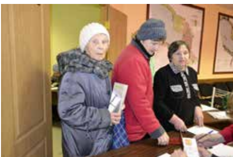
Вручение подарков ветеранам ко Дню снятия блокады