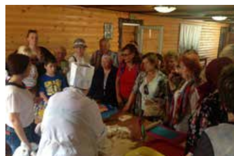
Экскурсия «Монастыри Приладожья»