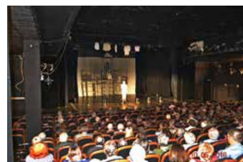
Посещение спектакля «А зори здесь тихие»