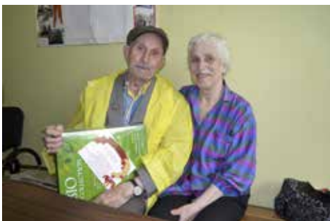
Вручение подарков ветеранам ко Дню Победы