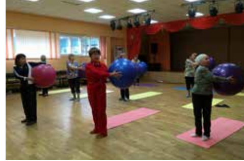
Социальная программа – фитнес для пожилых жителей округа