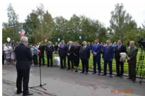
Открытие почтового отделения на ул. Шотмана