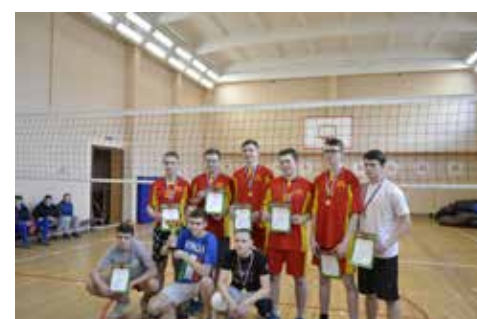
Турнир по волейболу