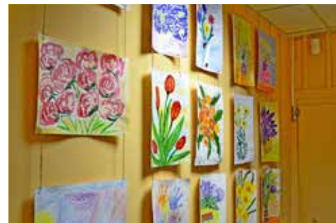
Конкурс детского рисунка, посвященный памятным датам