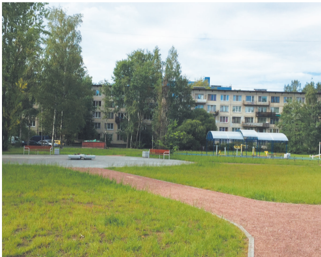
Ул. Крыленко, 33-37