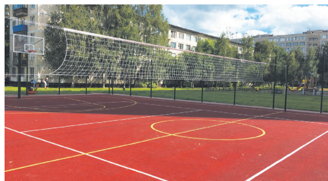
Ул. Тельмана, 30/2