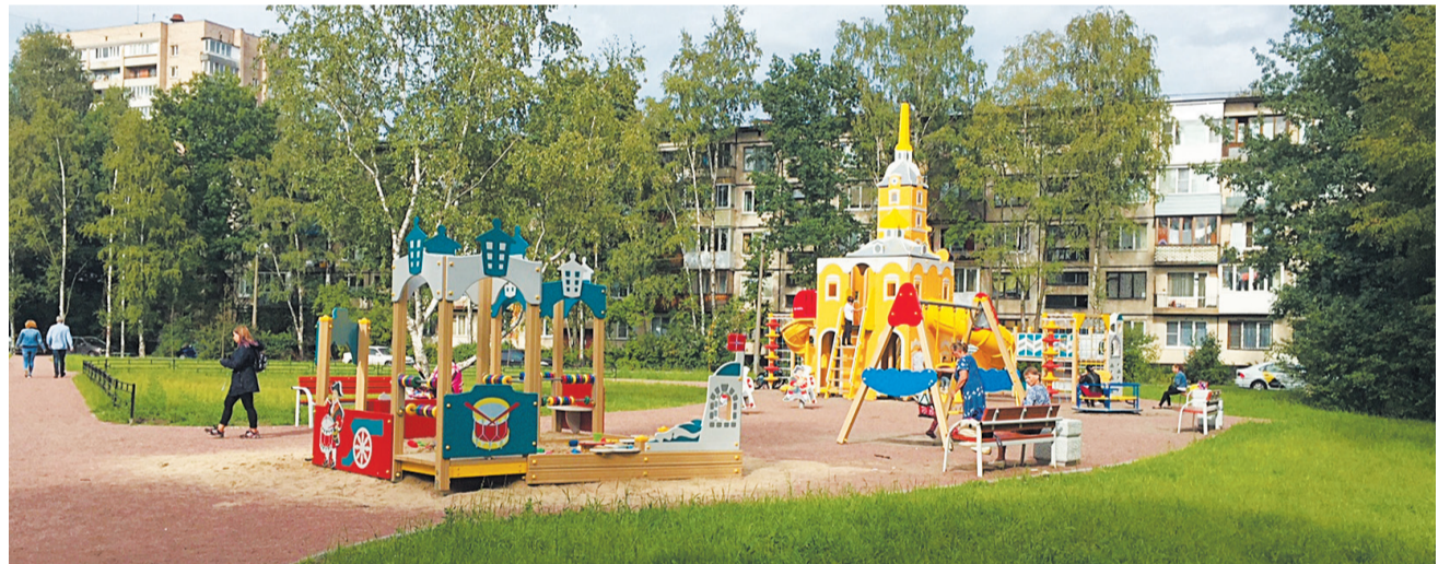
Ул. Крыленко, 33-37