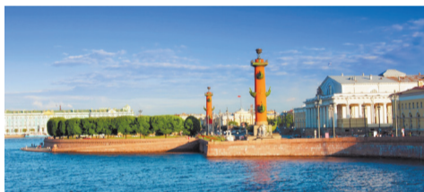
Стрелка Васильевского острова