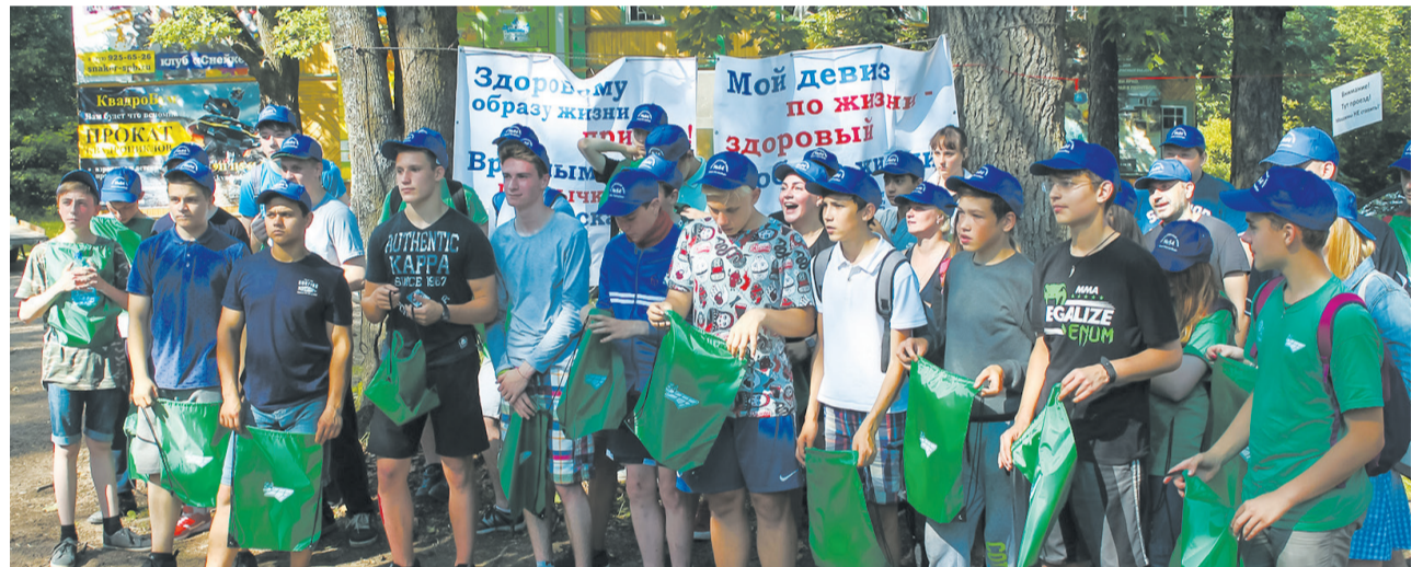
Финальное построение игроков