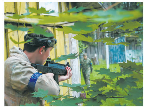
Главное – занять удачную позицию