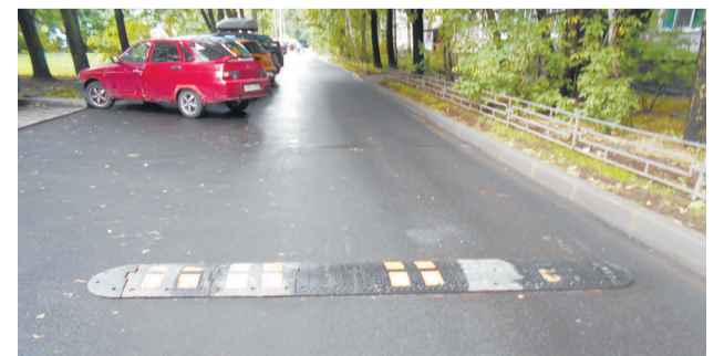
Ул. Тельмана, 54