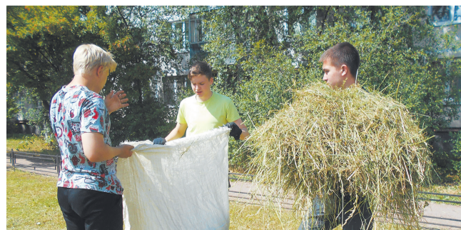
Работа трудового отряда