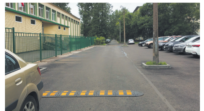
Гимназия 343, ул. Крыленко, 33/2