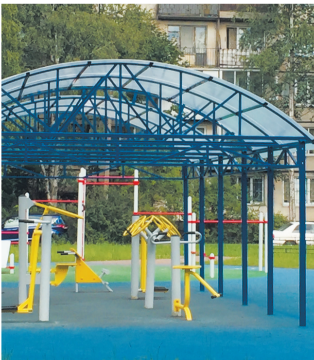
Ул. Крыленко, 33-37