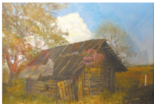
Елена Евгеньевна Забегаевская: «Баня». Рисунок маслом с черно-белой фотографии 30-х годов