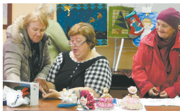
Участники встречи любуются работами