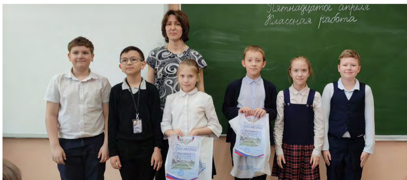
Участники конкурса – ученики ГБОУ СОШ №350