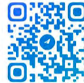
Фото и видеотчеты в группе «ВКонтакте»: https://vk.com/vmo54

С анонсами муниципальных мероприятий вы можете знакомиться в группе «Телеграм»: https://t.me/vmoto54