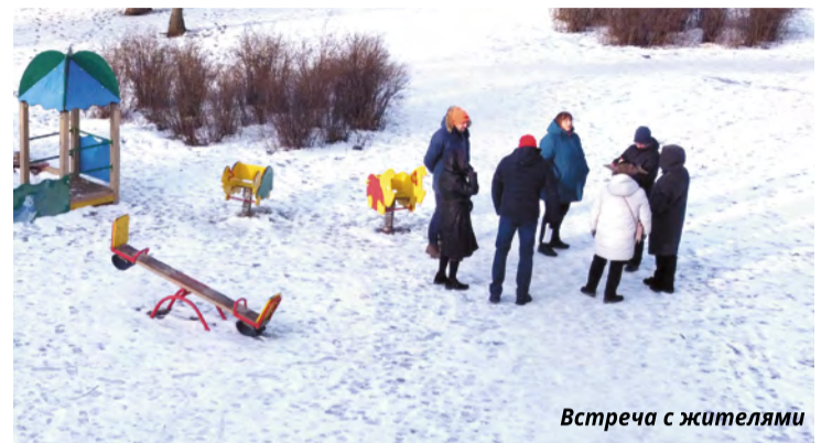
Встреча с жителями

Большое внимание проектом уделяется посадкам новых деревьев и кустарни-