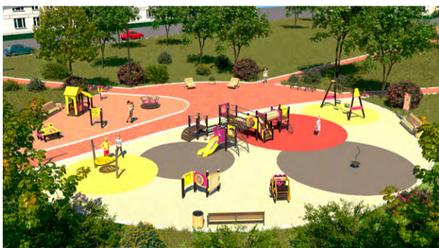
Детская площадка для детей в возрасте 3-7 лет (проект)

Не забудьте указать ваши контактные данные.