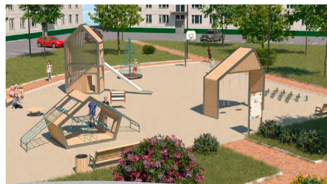
Детская площадка для детей в возрасте 5-12 лет (проект)

В зонах для игр детей и уличного спорта предусматривается организация универсальных, инклюзивных детских и спортивных площадок с мягким резиновым покрытием. На таких площадках будут комфортно себя чувствовать дети разных возрастных групп, в том числе и дети с ОВЗ и иные маломобильные группы населения (МГН).