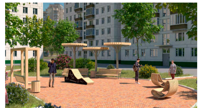
Зона отдыха (проект)

была предложена инновационная, современная идея – размещение системы отвода поверхностных и дренажных вод организованная в виде дождевого сада. Такой прием часто применяется в благоустройстве европейских городов, когда нет возможности организации инженерного дренажа с отводом излишней влаги в канализационную сеть.