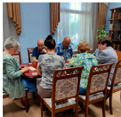
За игрой в уютной обстановке.