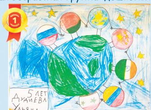
Дудиева Ульяна, 5 лет