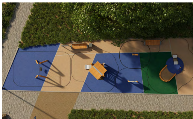
Ул. Евдокима-Огнева, д. 4, к.1