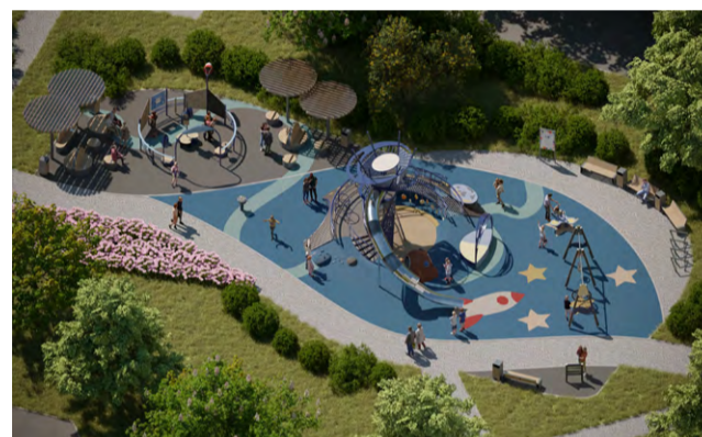
Ул. Крыленко, д. 17, к. 1 – д. 19, к. 2.