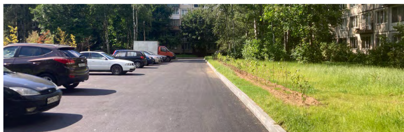
Ремонт асфальтовых покрытий

В рамках данного проекта были созданы четыре новые зоны для отдыха взрослого населения, а также спортивная и три детских площадки, в том числе учитывающие потребности детей с особенностями развития.