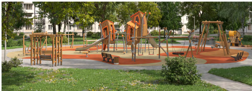
Ул. Тельмана, дом 32

В рамках указанных проектов нам также предстоит огромная работа по преобразованию дворовых территорий в комфортные и уютные пространства нашего муниципального округа.