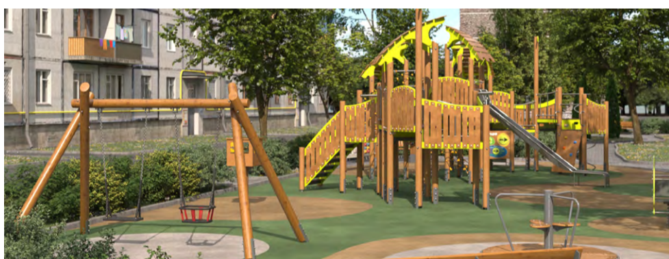
Дальневосточный пр., дом 30-3 – ул. Огнева, дом 6-4