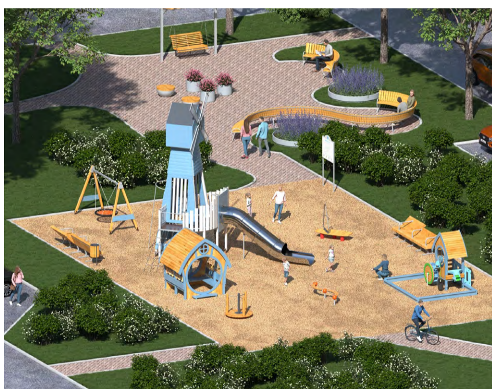
ул. Шотмана, дом 8