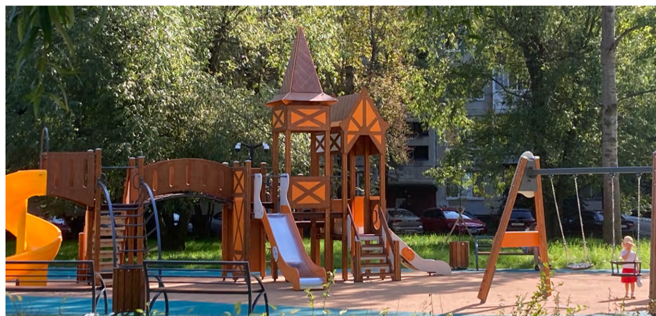
Ул. Крыленко, дом 29

Также нами были проведены работы по благоустройству на иных территориях муниципального округа, в частности: