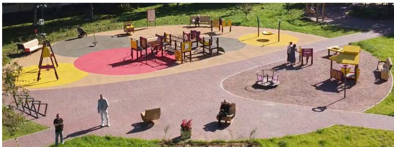
Ул. Тельмана, дом 40

Реализованный проект по адресу: улица Тельмана, дом 44 был представлен на XVII ежегодный конкурс по благоустройству территорий муниципальных образований Санкт-Петербурга и занял I место в номинации «Лучший объект озеленения».