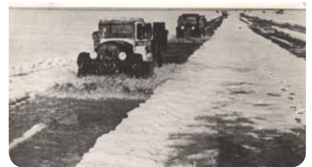
Редакция газеты «Новости Правобережья»

Дорогой жизни шёл к нам хлеб, дорогой дружбы многих к многим. Ещё не знают на земле страшней и радостней дороги.